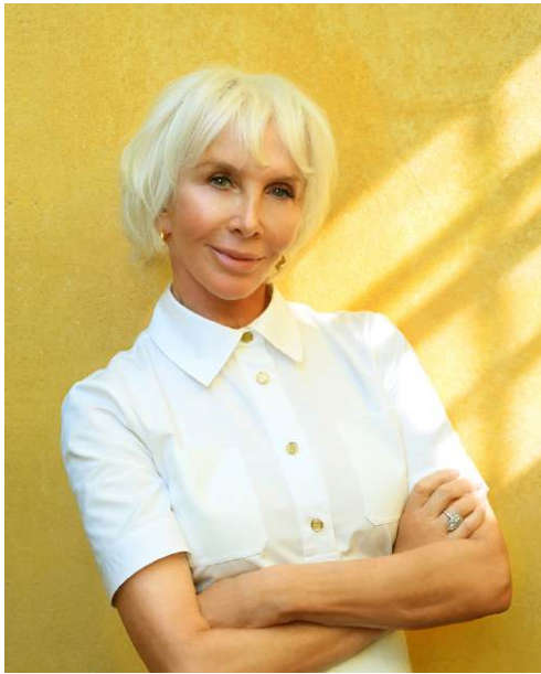
Trudie Styler PREMIO PASOLINI - CITTA' DI MATERA